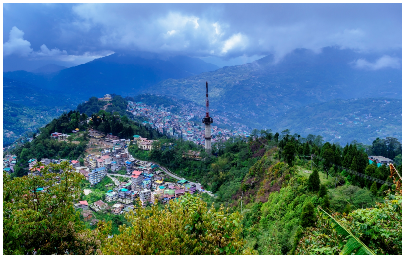
Вид на Гангток с высоты птичьего полета

Чунгтанг, Лачунг, Пеллинг, водопады Бан Джакри, озеро Купуп, озеро Гурудунмар, Монастырь Лачун и Монастырь Пемянцзе являются одними из других основных достопримечательностей неподалеку от Гангток.