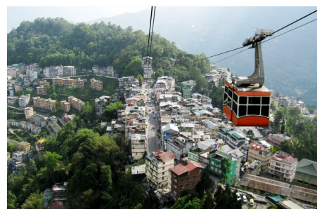
Поездка по канатной дороге над Гангтоком