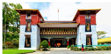
Намгьяльский научно-исследовательский и