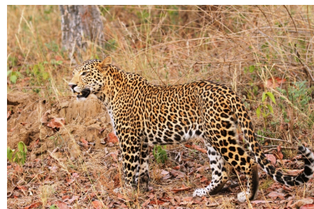
Леопард в Национальном парке Сатпура