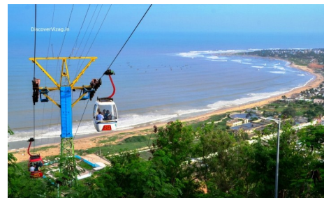
Канатная служба Холма Кайлас Гири