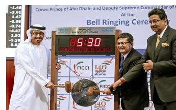
Наследный Принц Абу-Даби в БФБ, Мумбаи

12 февраля лидеры двух стран приветствовали открытие в