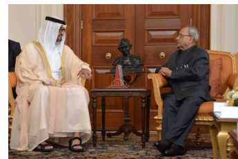
Наследный Принц Абу-Даби встречается с Президентом

Его Высочество Главный Шейх Мохаммед бин Зайед аль-Нахаян, Наследный принц Абу-Даби, Заместитель верховного главнокомандующего вооруженными силами ОАЭ совершил первый государственный визит в Индию 10-12 февраля 2016 года. 11 февраля Президент Транаб Мукерджи принял наследного Принца. Он выразил удовлетворение созданием институциональных механизмов, включая Совместную комиссию между Индией и ОАЭ. Касательно экономических отношений, Президент сказал, что Индия придает большое значение расширению двусторонних инвестиционных связей с ОАЭ. Наследный принц с взаимной теплотой ответил на слова Президента и выразил готовность продолжать работу по установлению крепкого моста дружбы и сотрудничества между Индией и ОАЭ.