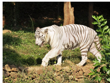
Зоологический парк им. Индиры Ганди