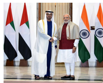
Премьер-Министр встречается с наследным Принцем Абу-Даби

Премьер-министр Моды и Наследный принц провели широкие дискуссии и обменялись мнениями по двусторонним, региональным и многосторонним вопросам, представляющим взаимный интерес. Лидеры двух стран объявили о своем решении закрепить новое стратегическое направление отношений ОАЭ-Индия во Всеобъемлющем соглашении о стратегическом партнерстве, устанавливающее основные принципы сотрудничества и определяющее дорожную карту для углубления сотрудничества. Премьер-Министр выделил основные мероприятия, проведенные правительством для улучшения простоты ведения бизнеса в стране и пригласил ОАЭ стать партнером в истории роста Индии и принять участие в проектах по созданию мега промышленных, производственных коридоров. Наследный принц высоко оценил динамично развивающиеся идеи Премьер-Министра Моды «Стартап Индия», «Сделай в Индии», «Умный город» и «Чистая Индия», отмечая их большой потенциал в обеспечении положительного импульса Индийской экономики, насчитывающей 2 трлн. долларов США, для роста и ускорения прогресса в двустороннем сотрудничестве между двумя странами.