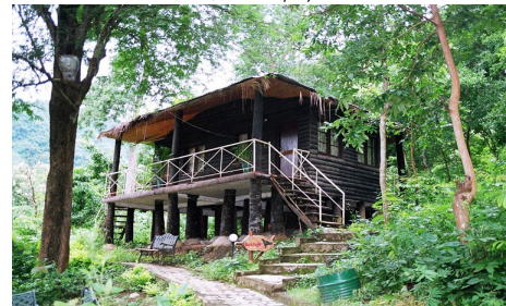
Природный Лагерь «Джингл Белс»